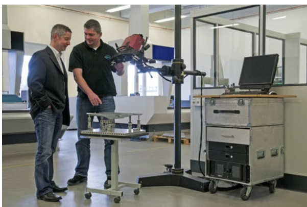
图 2：通过投资可移动式 ATOS 三维扫描仪这一全场表面光学三维坐标测量系统，吉地亚公司 (GEDIA) 得以实现从触觉测量到光学测量的转变。既可立即比较测得的测量数据，还可直接将其跟 CAD 数据进行比较。与 CAD 的偏差可用彩色突出显示，便于识别有问题的区域，从而有针对性地改善生产工艺。

经过将触觉测量设备安装在机械臂上的各种可移动式尝试，该公司已了解到触觉测量已无法满足其需求，应该重新考虑所采用的测量技术了。通过投资可移动式 ATOS 三维扫描仪这一全场表面光学三维坐标测量系统，吉地亚公司 (GEDIA) 得以实现从触觉测量到光学测量的转变。这也标志着朝向保持其技术领先地位这一主要目标迈出的重要第一步。（图 2）