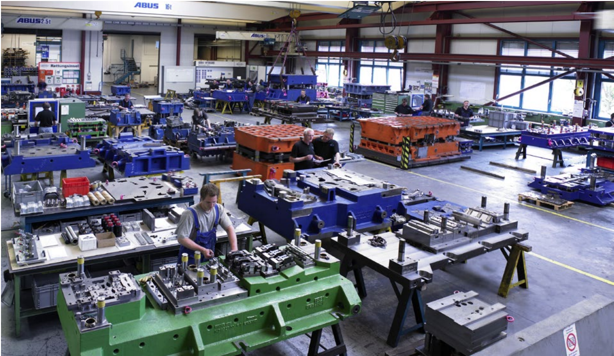
图 3：通过光学测量系统，更易于有效校准工模具，保证使验收模具之前的迭代修改次数更少。

根据全场表面数据创建的测量报告除了清晰易读，另外一项好处是：对比为单个测量点生成的测试报表，这里的报告表现性更佳、可读性更强。这有利于减少讨论时间，可快速有效地实施必要的校正。