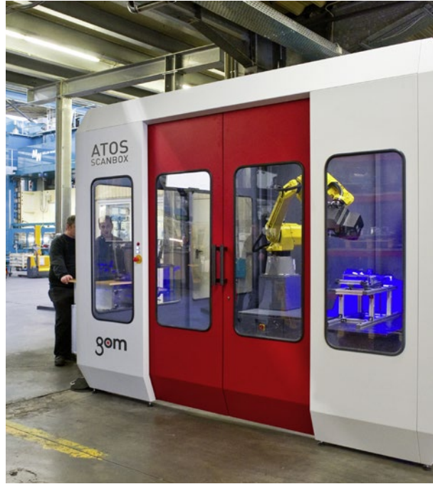
图 5: 标准化 ATOS ScanBox 具有全自动三维数字化处理和检测所需的所有元件。对比之前所用的触觉测量, 在吉地亚公司 (GEDIA) 的 Attendorn 冲压车间里, 利用新技术, 所需的测量时间减少了一半。