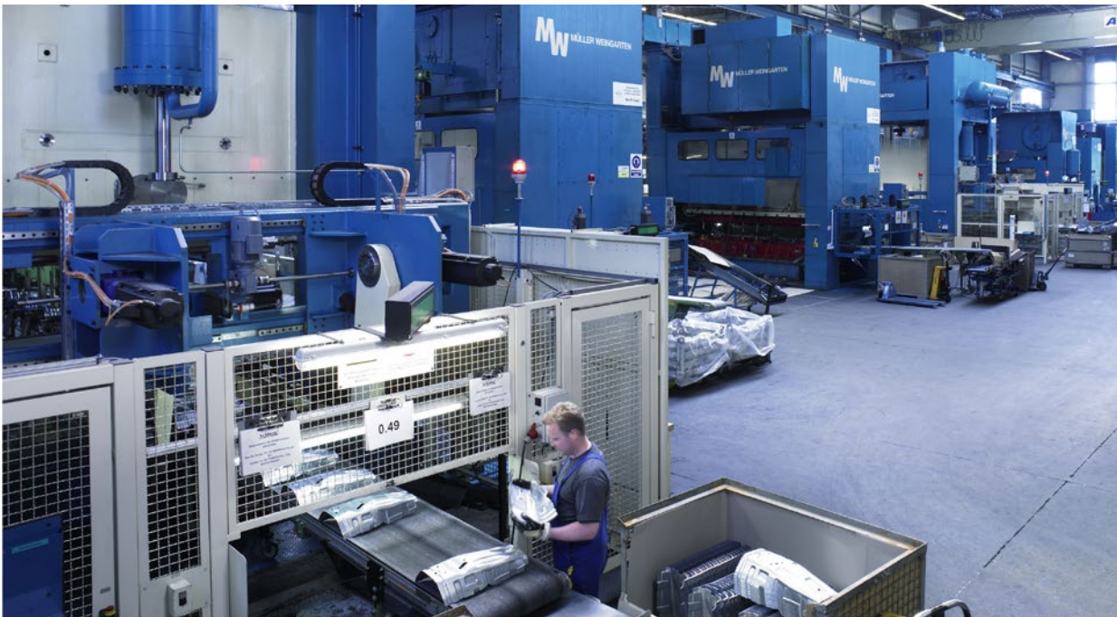
图 1: 吉地亚公司 (GEDIA) 将在其全球范围内的产品和生产基地的诸如冲压、接合及组装车间等都采用全场表面光学三维坐标测量技术。

跟许多企业必须调整生产流程以适应生产力水平的提高一样，吉地亚公司 (GEDIA) 面临的挑战是要找到缩短测量时间的方法。在缩短周期时间并增加产量的同时，还必须保证生产质量。在触觉测量形状复杂的部件时，取证时间相对更长，流程更繁琐，即便是几个部位，就需要花费相当长的时间。