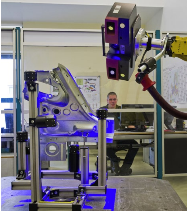
图 4: 吉地亚公司 (GEDIA) 的第一个自动化解决方案是集成 GOM 设备的定制测量间。